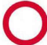
(P-8) Κλειστή οδός για όλα τα οχήματα και προς τις δύο κατευθύνσεις.