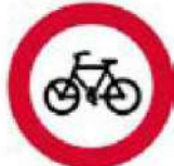
(P-11) Απαγορεύεται η είσοδος στα ποδήλατα.