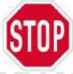
(P-2) Υποχρεωτική διακοπή πορείας.