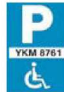
(P-72) Χώρος στάθμευσης αποκλειστική για συγκεκριμένο όχημα ατόμων με μειωμένη κινητικότητα, ύστερα από ειδική άδεια και με αριθμό κυκλοφορίας...