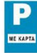
(P-69) Χώρος στάθμευσης με κάρτα.