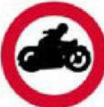
(P-10) Απαγορεύεται η είσοδος στις μοτοσικλέτες.