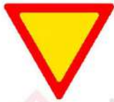
(P-1) Υποχρεωτική παραχώρηση προτεραιότητας.