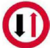
(P-5) Προτεραιότητα της ανθίεως ερχόμενης κυκλοφορίας λόγω στενότητας οδοστρώματος.