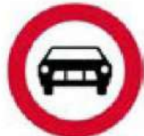
(P-9) Απαγορεύεται η είσοδος σε μηχανοκίνητα οχήματα εκτός των δίτροχων μοτοσικλετών.