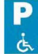
(P-71) Χώρος στάθμευσης αποκλειστικά για οχήματα ατόμων με μειωμένη κινητικότητα, ύστερα από ειδική άδεια.