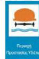
(P-75) Επιβάλλεται ιδιαίτερη προσοχή σε οχήματα που μεταφέρουν επικίνδυνες ύλες που μπορούν να προκαλέσουν μόλυνση των υδάτων.