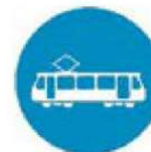
(P-76) Αποκλειστική διέλευση τροχιοδρόμου.