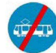
(P-77) Τέλος αποκλειστικής διέλευσης τροχιοδρόμου.