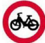
(P-12) Απαγορεύεται η είσοδος στα μοτοποδήλατα.