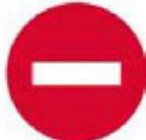
(P-7) Απαγορεύεται η είσοδος σε όλα τα οχήματα.