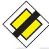
(P-4) Τέλος οδού προτεραιότητας.